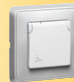
Gniazdo 2P+Z IP44