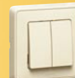
Łączniki: - świecznikowy - schodowy podwójny