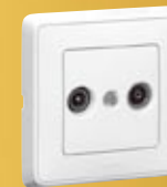
Gniazdo telewizyjne TV-RD