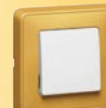
Łączniki: - jednobiegunowy - krzyżowy