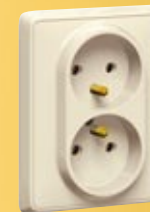
Gniazdo podwójne 2 x 2P+Z