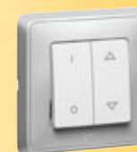
Łącznik sterowania roletami