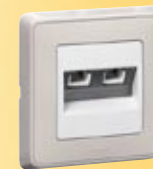
Gniazdo telefoniczne 2 x RJ 11