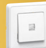
Łącznik schodowy podświetlany