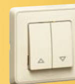
Przycisk sterowania roletami