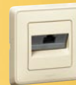
Gniazdo informatyczne 1 x RJ 45 kat. 6 UTP